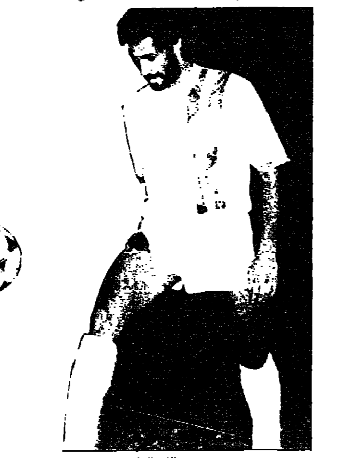
عبدالله الخريزان سعد العصيمي - مكة المكرمة : احمد صالح - الدعوم : من جهة اخرى تمام اليوم مباريات لاتقان اهمية عن لقاء جدة - فيمكة المكرمة يستضيف فريق الوحدة فريق الرياض في مباراة هامة جدا للفريقين حيث يدخل الوحدة اللقاء برصيد ٤ نقاط من ٥ مباريات فيما يفوضه الرياض بنفس الرصيد من خمس مباريات ، حيث لم يلعب امام الاتفاق والهلال ، وقد فاز الفريق في اخر مبارياته على الراند بالرياض حيث الحق به